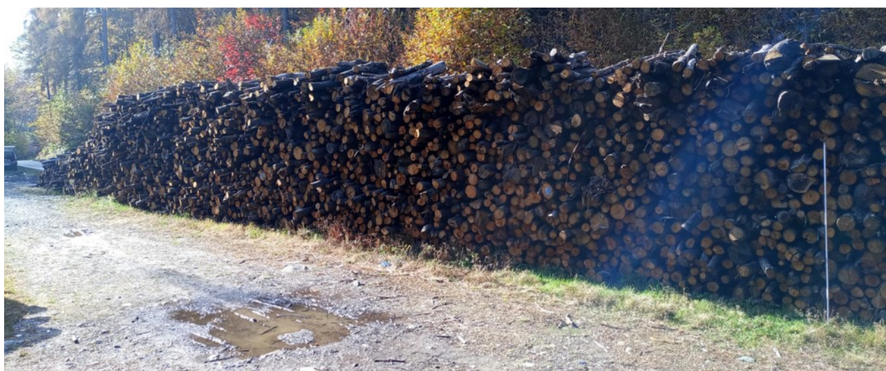
Lotto 3 – Castagno da tannino (SX) – l'asta fotografata misura 3 m