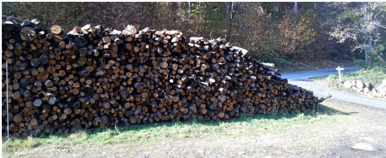
Lotto 3 – Castagno da tannino (DX) – l'asta fotografata misura 3 m