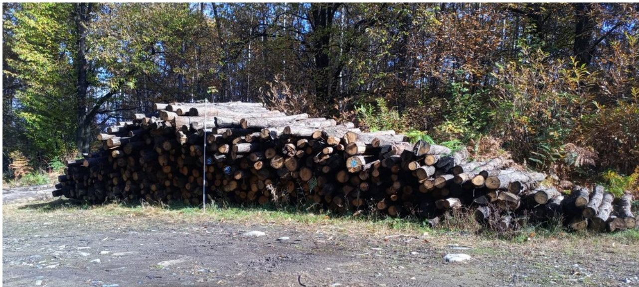
Lotto 2 – Castagno da paleria (pali da 4 m) – l'asta fotografata misura 3 m