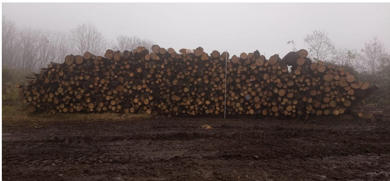
Lotto 7 – legname da ardere (piazze balmella cippo) – l'asta fotografata misura 3 m