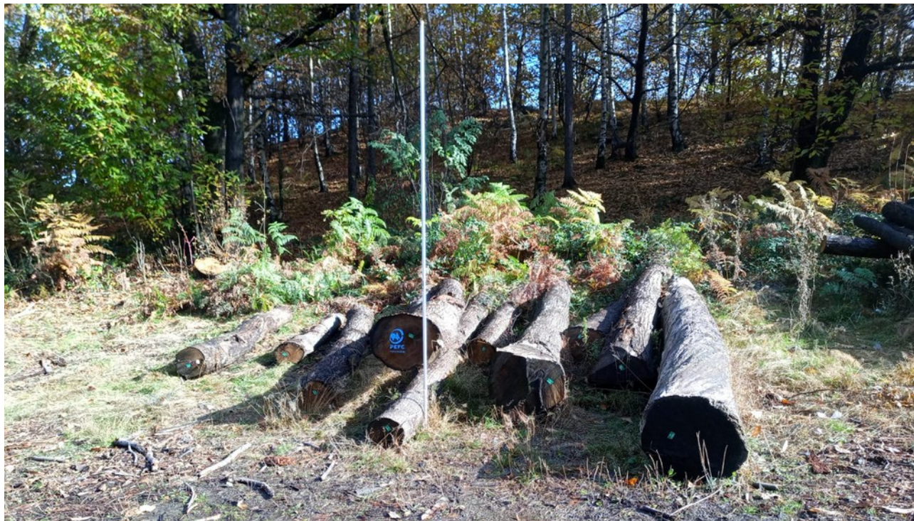
Lotto 1 – Legname da opera – l'asta fotografata misura 3 m