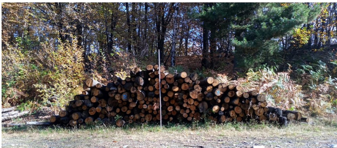
Lotto 2 – Castagno da paleria (pali da 3 m) – l'asta fotografata misura 3 m