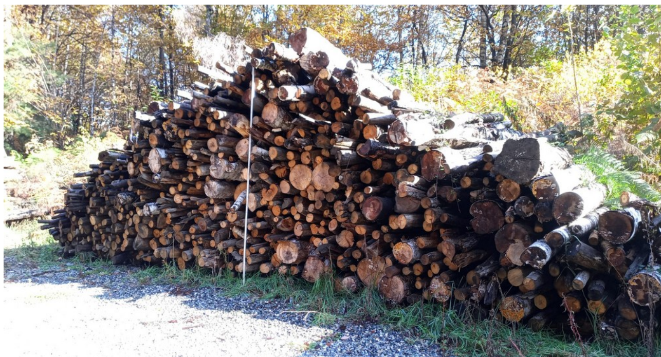
Lotto 4 – Legname da ardere – l'asta fotografata misura 3 m