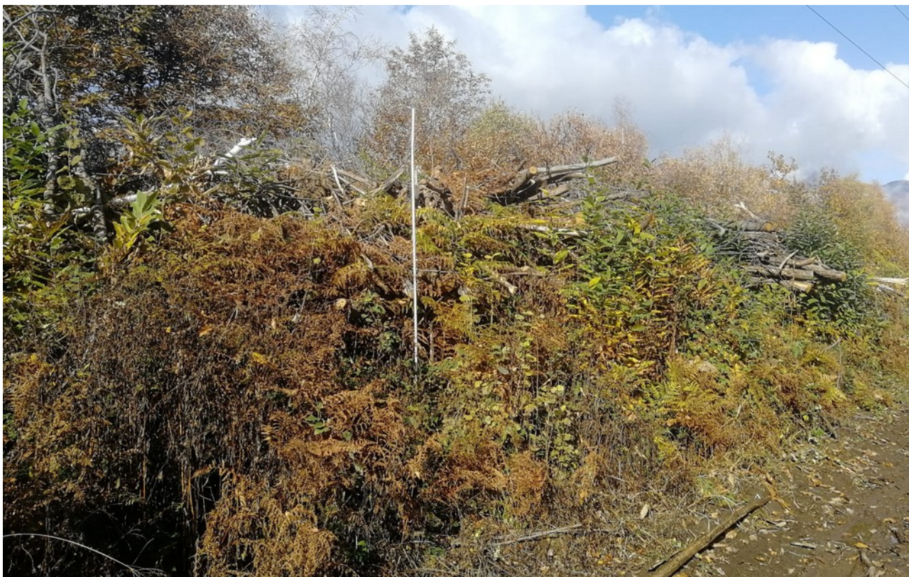
Lotto 6 – Ramaglia da triturazione – l'asta fotografata misura 3 m