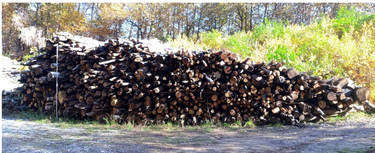
Lotto 5 – Legname da ardere – l'asta fotografata misura 3 m