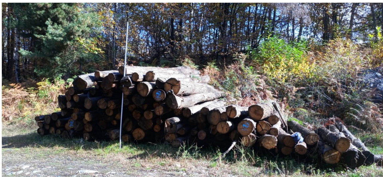
Lotto 2 – Castagno da paleria (pali da 5 m) – l'asta fotografata misura 3 m