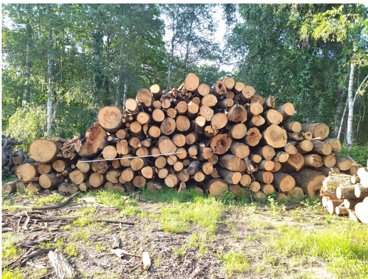
Lotto B – Castagno da tannino

N.B. L'asta ripresa nelle fotografie misura 3 m di lunghezza