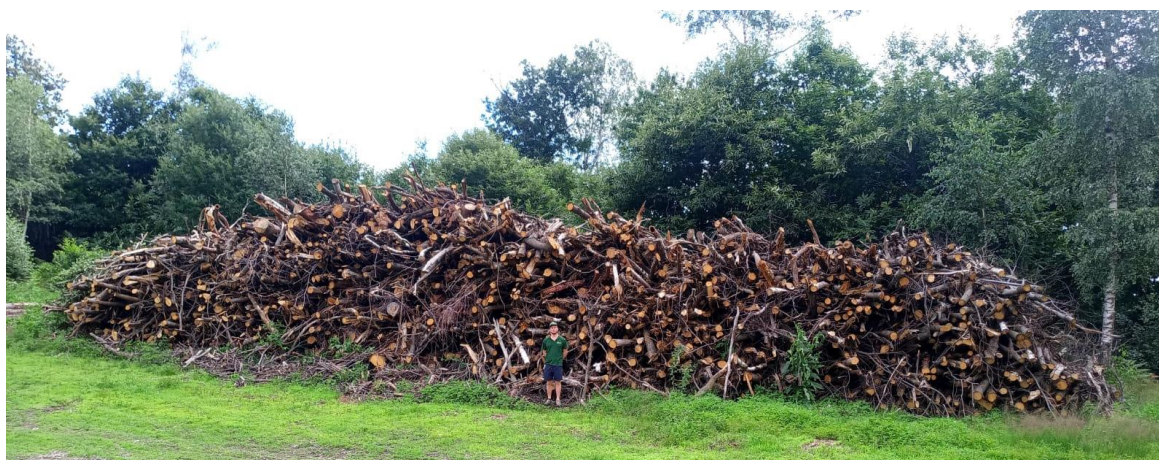
Lotto 4 – Ramaglie e cimoli da triturazione