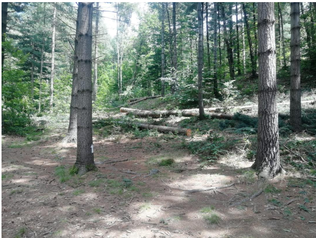
Lotto 7 – Pino strobo e larice da imballaggio - Toppi a terra da esboscare