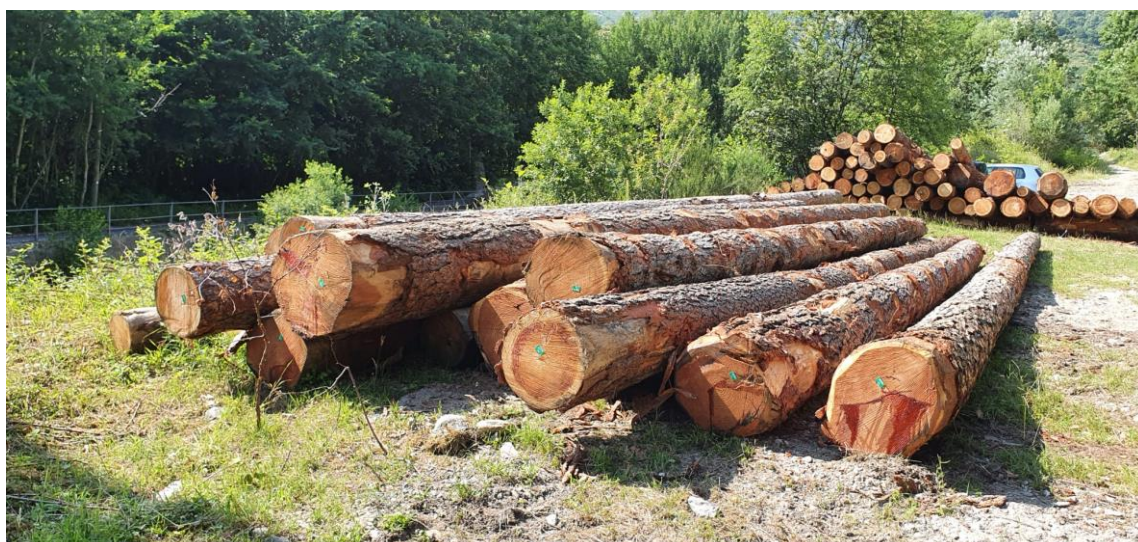
Lotto 5 – Larice da opera – catasta B