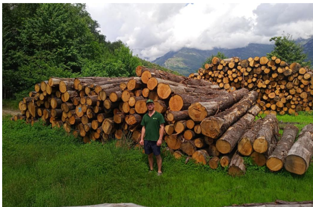
Lotto 1 – Castagno da paleria – pali 4 m