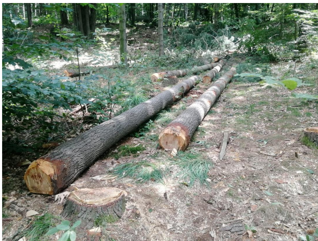
Lotto 7 – Pino strobo e larice da imballaggio - Toppi a terra da esboscare