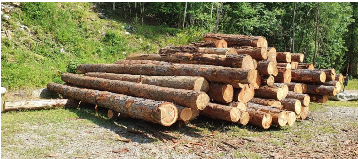
Lotto 5 – Larice da opera – catasta A