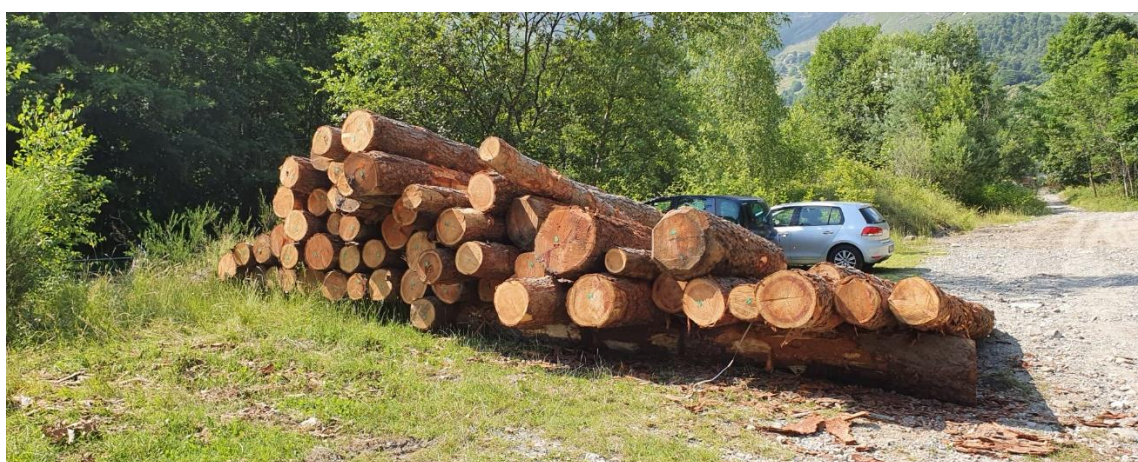
Lotto 6 – Larice da imballaggio