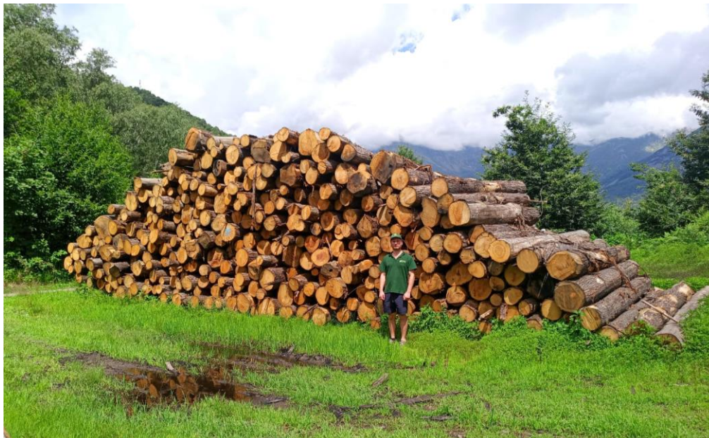
Lotto 1 – Castagno da paleria – pali 3 m