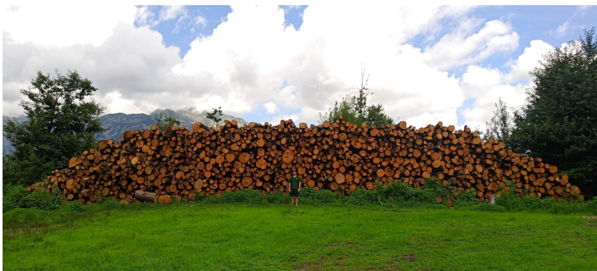
Lotto 2– Castagno da tannino