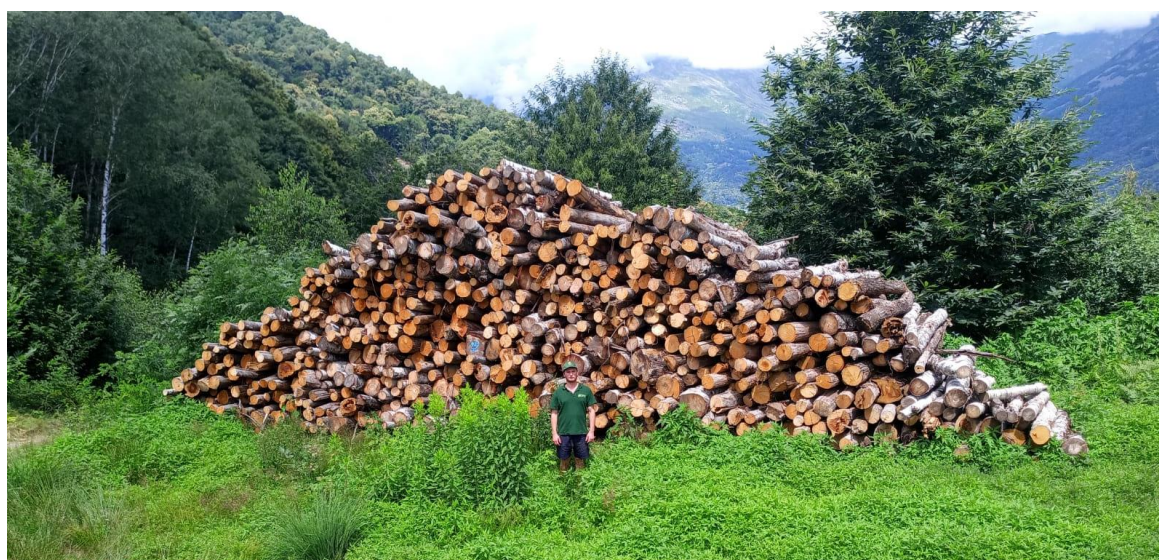
Lotto 3 – Legna da ardere