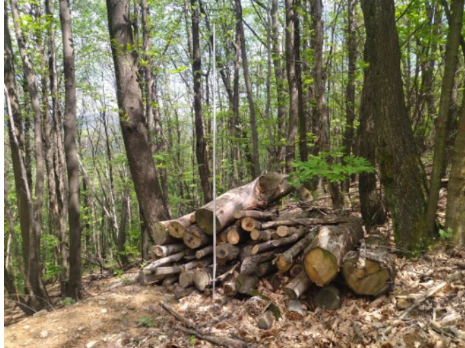
L'asta graduata presente nelle foto misura 3 m.